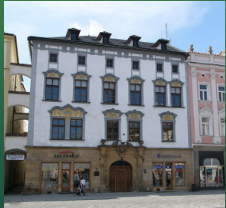
Johann Christoph Gottsched